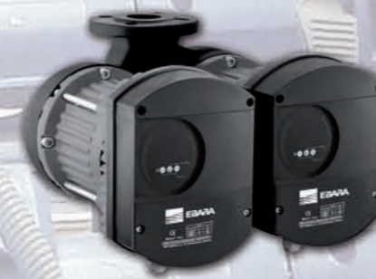
Ego gemela con bridas para uso residencial e industrial.