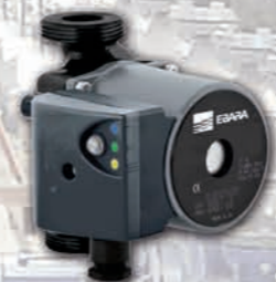
Ego simple con conexiones roscadas.