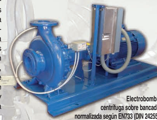
Electrobomba centrífuga sobre bancada normalizada según EN733 (DIN 24255) con control de velocidad. GS VV / ENR VV.