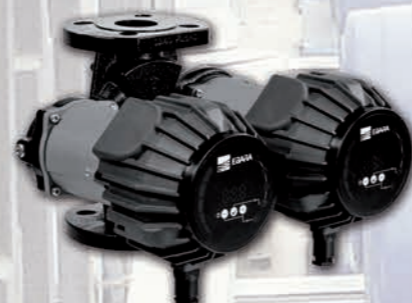
Ego Slim doble con bridas.

Gama de bombas circuladoras de control electrónico con motores de "Imán Permanente". Las bombas circuladoras Ego se diferencian de las bombas estándar por su autorregulación en función de las demandas reales de la instalación; esta función permite un gran ahorro energético, y además garantiza una reducción de los niveles sonoros. La gama Ego cumple con la Directiva Europea EuP / ErP sobre eficiencia energética.