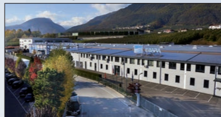
Cles - ITALIA