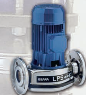
Electrobomba sencilla en AISI 304 para Agua Caliente Sanitaria (A.C.S.)