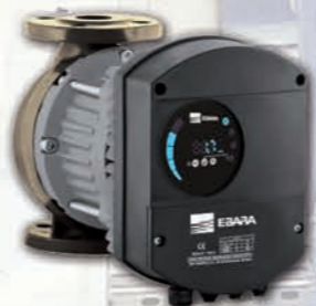
Ego B simple con bridas fabricada en bronce para uso residencial e industrial.