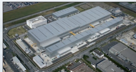
Futtsu (100.000 m²) - JAPÓN

EBARA adoptó en España su actual configuración en el año 1991, tras la fusión por absorción de cuatro compañías nacionales.