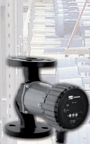
Ego Easy simple con bridas.

Circuladoras de alta eficiencia y control electrónico con motores de "imanes permanentes".