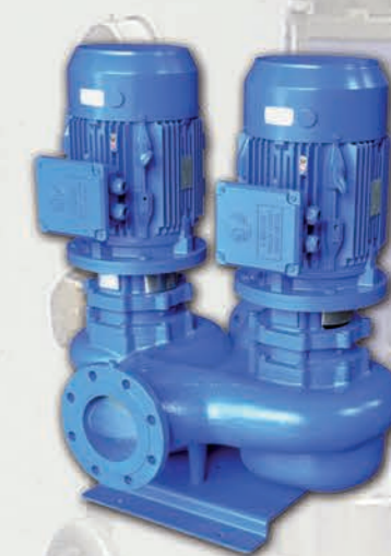
Electrobomba centrífuga vertical In-Line doble EBARA ELINE-D.