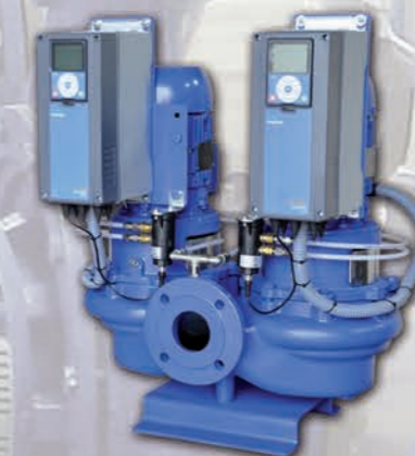
Electrobomba centrífuga vertical In-Line doble con control de velocidad EBARA ELINE-D VV.