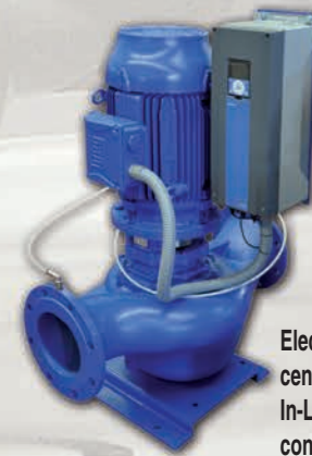
Electrobomba centrífuga vertical In-Line simple con control de velocidad EBARA ELINE VV.

Las bombas para climatización EBARA cumplen con normativa: