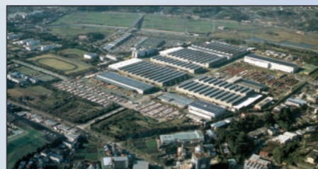
Fujisawa (430.000 m²) - JAPÓN