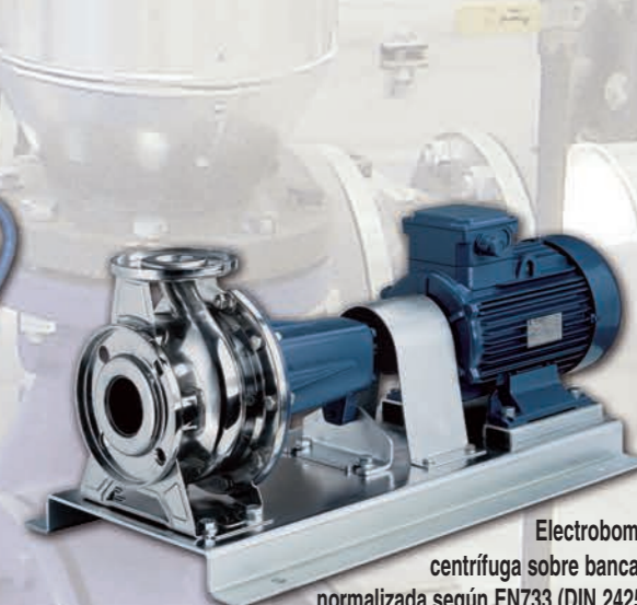
Electrobomba centrífuga sobre bancada normalizada según EN733 (DIN 24255) Acero Inoxidable AISI 304 / 316L 3P / 3LP