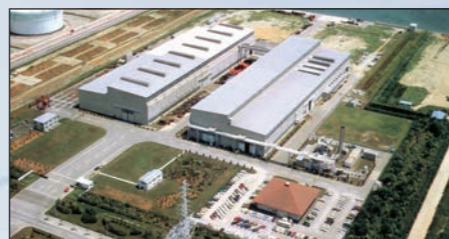
Sodegaura (215.000 m²) - JAPÓN