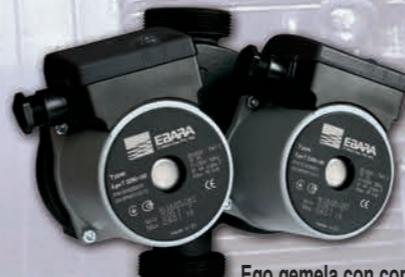
Ego gemela con conexiones roscadas.