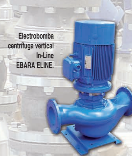
Electrobomba centrífuga vertical In-Line EBARA ELINE.

Electrobombas monobloc tipo In-Line para HVAC