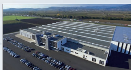
Gambellara - ITALIA