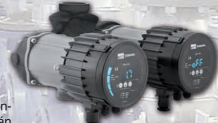
Ego Easy gemela con conexiones roscadas.