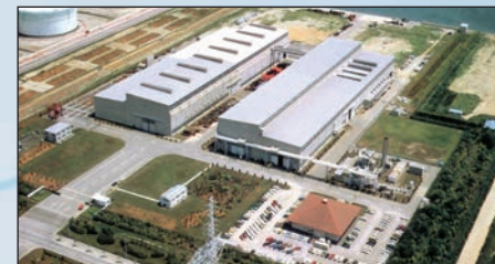
Sodegaura (215.000 m 2 ) - JAPÓN