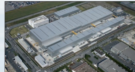
Futtsu (100.000 m 2 ) - JAPÓN

EBARA en la Península Ibérica es una empresa nacional fabricante de Bombas Centrífugas, Grupos de Presurización de agua y Equipos Contra Incendios, igualmente filial de la corporación Industrial Japonesa EBARA Corporation. EBARA adoptó en España su actual configuración en el año 1991, tras la fusión por absorción de cuatro compañías nacionales.