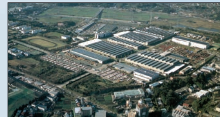
Fujisawa (430.000 m 2 ) - JAPÓN