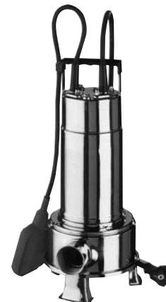
Bomba utilizada no Sistema MINI RIGHT