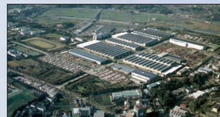
Fujisawa (430.000 m 2 ) - JAPÃO