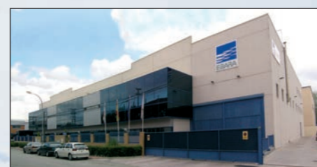
Pinto (Madrid) - ESPANHA