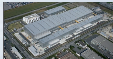
Futtsu (100.000 m 2 ) - JAPÃO

TIFQ Produtos idóneos para o contacto com água destinada ao consumo humano.