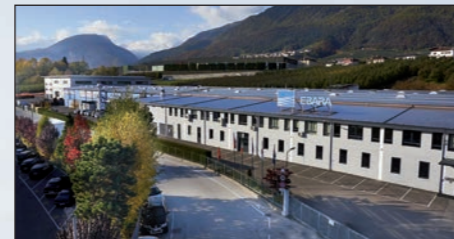
Cles - ITÁLIA