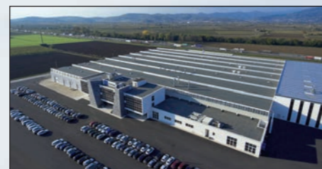
Gambellara - ITÁLIA