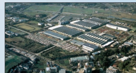
Fujisawa (430.000 m²) - JAPÃO