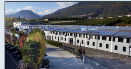
Cles - ITÁLIA